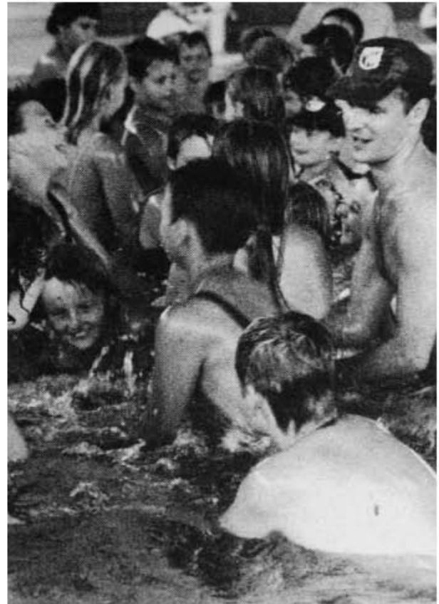
Spielen im Wasser macht Spaß.

Das Jahr 1988 wurde wieder dem Breitensport gewidmet. Über 100 Kinder und Jugendliche wurden bei den Übungsabenden gezählt. Die Aktiven waren mit guten Leistungen bei sechs Einzelwettkämpfen. Auch die beiden traditionellen Wettkämpfe standen wieder auf dem Programm, und auch 1989 sollten diese wieder durchgeführt werden. Das Jahr 1989 war im Bereich des Breitensports wieder voller Aktivitäten. Die Zahl der Kinder im Nichtschwimmer-