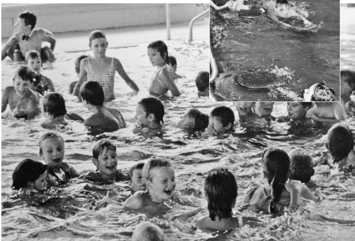
Übung macht den Meister.