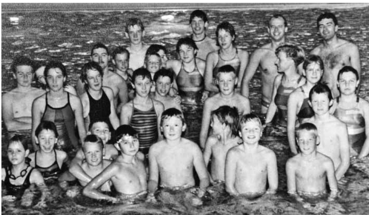
Ein Teil der Schwimmgruppe aus dem Jahr 1985.

sammenarbeit mit der TSG Giengen und der TSG Nattheim sollte noch intensiviert werden.