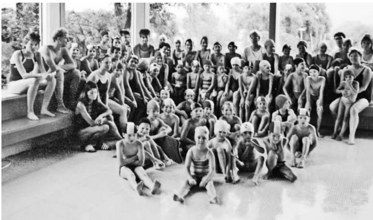
1985: Die Übungsstunden sind gut besucht.