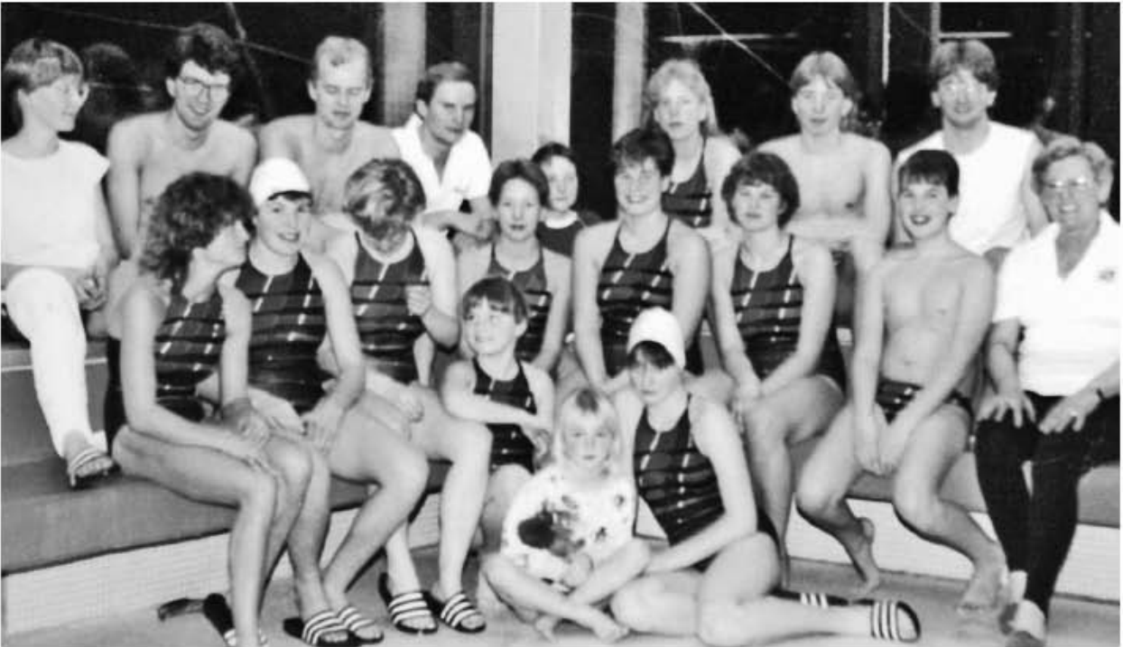
Die Talente 1986.